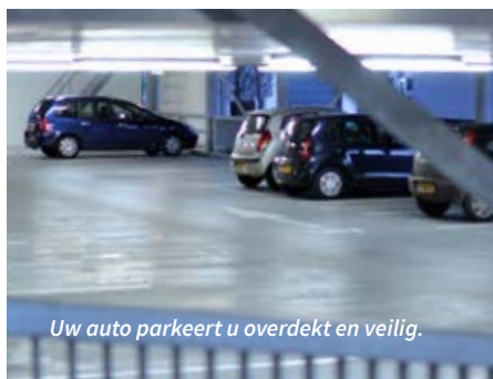
Uw auto parkeert u overdekt en veilig.